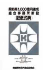
契約高1,000億円達成 組合事務所新設 記念式典