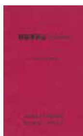
秋田県火災の あゆみ