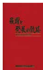
飛躍と発展の軌跡 県火災共済20年史