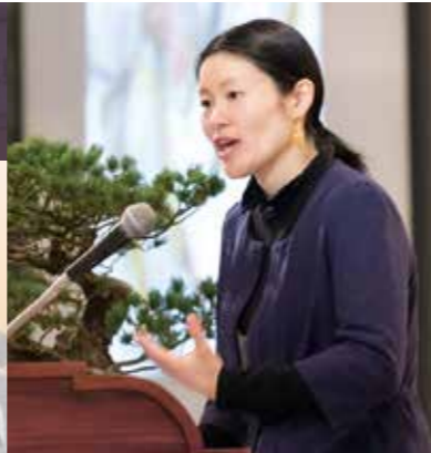
〔講師〕 フォトグラファー 小松由佳氏

1982年秋田県生まれ。2006年“世界でもっとも困難な山”と称される世界第二の高峰K2(8,611m/パキスタン)に日本人女性として初めて登頂を果たす。植村直己冒険賞受賞、秋田県民栄誉章受章(いずれも2006年)。2012年からはシリア内戦の取材をし、現在はフォトグラファーとしてシリア難民の今を伝える活動を行う。