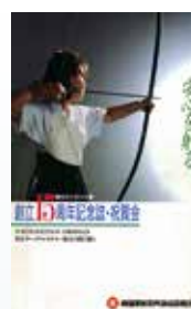
創立15周年記念誌・ 祝賀会