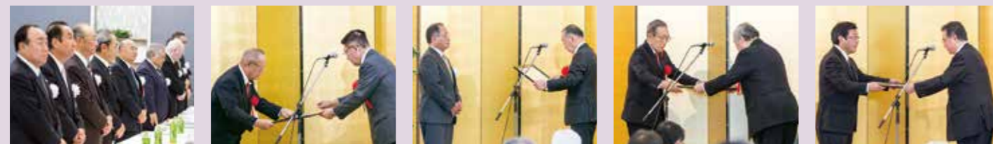
(知事表彰) (日火連会長表彰) (東北自共表彰) (理事長感謝状)