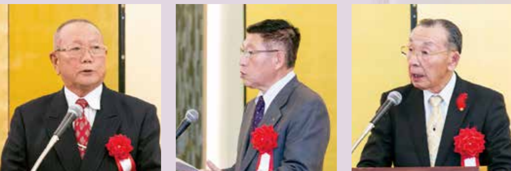
(開会の言葉/近藤道哲) (知事祝辞/佐竹敬久氏) (日火連会長祝辞/川瀬重雄氏) (理事長あいさつ)